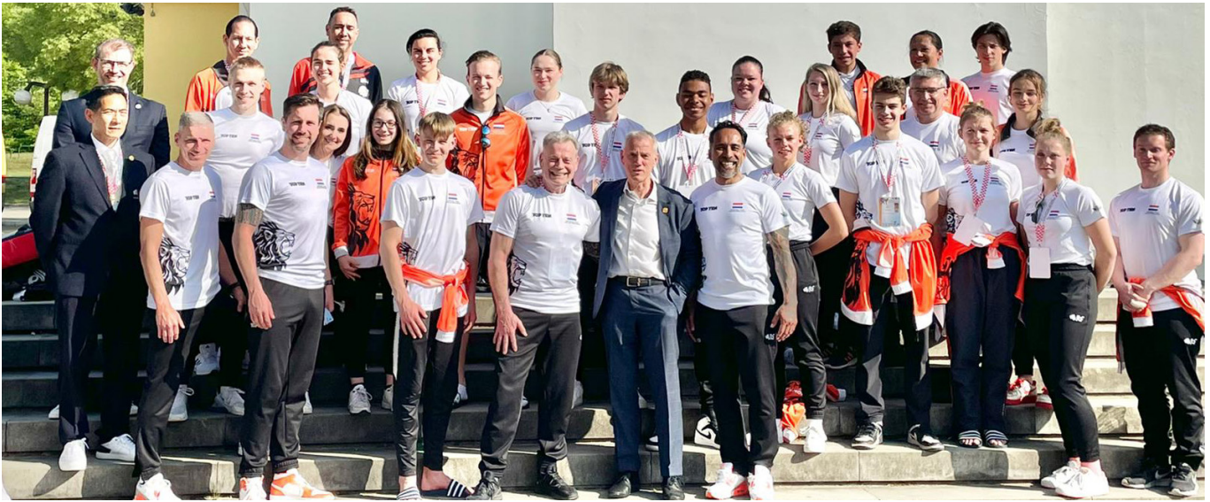
Nederlands team op het EK 2022 in Porec, Kroatië

De geschatte totale kosten voor het WK liggen op €750 - 1,000. Dit omvat het inschrijfgeld (€150,-), sponsorpakket (€100,-), hotel (€550,-, inclusief ontbijt, lunch, diner) en vlucht. Deze verkorte aanvulling op de 'selectieprocedure 2023' is vastgesteld door veranderingen binnen de TSC, afwijkingen van de procedure in de selectie voor het EK 2023, en wijzigingen in de regels vastgesteld door I.T.F. Mochten er vragen zijn over de deze aanvulling kunnen deze gericht worden aan tsc@itf-nederland.nl .